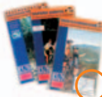
Fun Bike • MTB-Gebietsführer Fun Bike • Guida itinerari per MTB