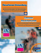
Fun Bike • MTB-Weekend