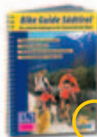
Fun Bike • Radwegeführer Fun Bike • Guida ciclabili